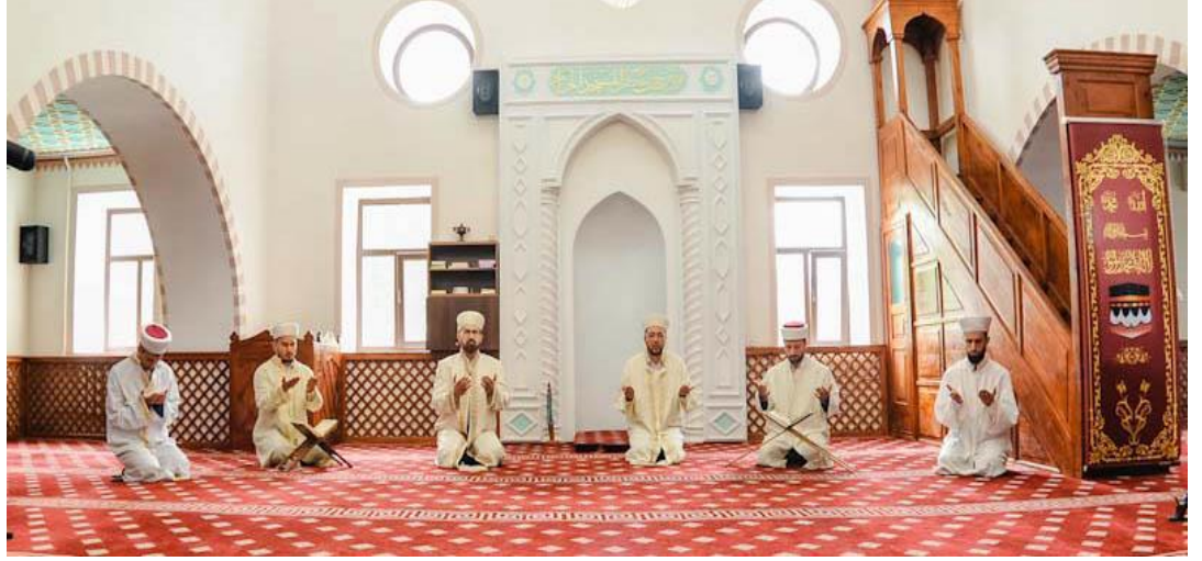
Fotoğraf: Kırım ve Sivastopol Müftülüğü'nde kurbanların anısına yapılan dua

Saat 12.00'de Simferopol'ün Merkezî Kebir Camii'nde Kırım Müftülüğü temsilcileri, kurbanları anma duası yaptı. Millet TV ve Vatan Sevdası radyo kanalı, camiden canlı yayın yaptılar.